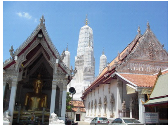
ภาพที่ 3 วัดมหาธาตุวรวิหาร

เลือกพื้นที่ 3 แห่ง คือ หาดหัวหิน หาดเขาเต่า และเขาตะเกียบ