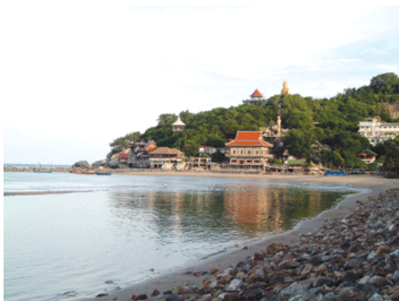
ภาพที่ 6 เขตตะเกียบ