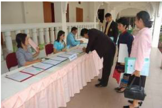
ภาพที่ 7 ประชุมระดมความคิดเห็น

6.4 นำผลการประชุมทั้งสามด้านมาวิเคราะห์ความเชื่อมโยงที่เกี่ยวข้องซึ่งกันและกัน โดยใช้เทคนิคการสรุปสะสม (Cumulative Summarization Technique) และการพรรณนาวิเคราะห์ (Descriptive Analysis)