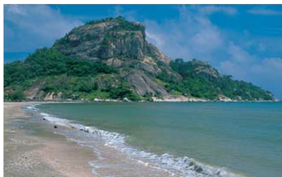
ภาพที่ 5 หาดเขาเต่า