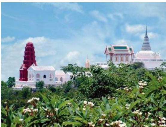
ภาพที่ 2 อุทยานประวัติศาสตร์พระนครคีรี