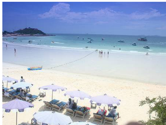
ภาพที่ 4 หาดหัวหิน