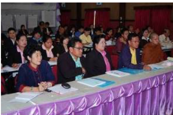
ภาพที่ 8 ประชุมระดมความคิดเห็น