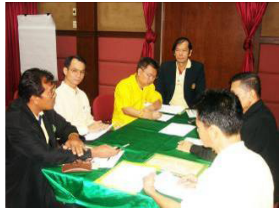
ภาพที่ 9 ประชุมระดมความคิดเห็น