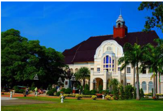
ภาพที่ 1 พระราชวังรามราชนิเวศน์

เลือกแหล่งพื้นที่ 3 แห่ง คือ พระราชวังรามราชนิเวศน์ อุทยานประวัติศาสตร์พระนครคีรี และ