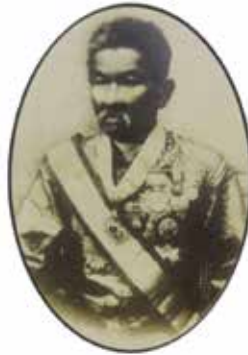
ภาพที่ 6 ภาพถ่ายพระยาโชฎึกราชเศรษฐี เจ้าคณะใหญ่อินนิการูปที่ 1 (เถียน โชติกเสถียร)