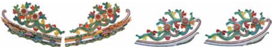
ภาพที่ 18 ประติมากรรมปูนปั้นประดับหลังคา ลายดอกไม้ใบไม้ไม้ม้วน (ฉ้อบัว)