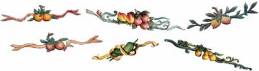
ภาพที่ 17 ประติมากรรมรูปพืชมงคลต่างๆ เช่น ส้ม ทับทิม ส้มโอ ลูกท้อ ฯลฯ