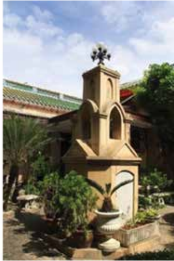
ภาพที่ 36 เปรียบเทียบภาพถ่ายสถาปัตยกรรมเจดีย์สมัยก่อน กับ ปัจจุบัน พ.ศ.2556

เจดีย์บูรพาจารย์ ภาษาจีนเรียกว่า “ไห่หุ้ยถ่า” แปลว่า “พุทธสาครเจดีย์” เป็นเจดีย์บรรจุอัฐิบูรพาจารย์ที่เป็นอดีตเจ้าอาวาสของวัดมังกรกมลาวาส เจดีย์นี้สร้างตั้งแต่สมัยกวางซวี ในรัชกาลที่ 5 ปี ค.ศ. 1902 (พ.ศ. 2445) สร้างโดยพระอาจารย์กวยหงอ ซึ่งเป็นเจ้าอาวาสองค์ที่ 2