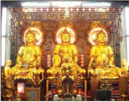
ภาพที่ 19 พระพุทธเจ้า 3 องค์ในพระอุโบสถ