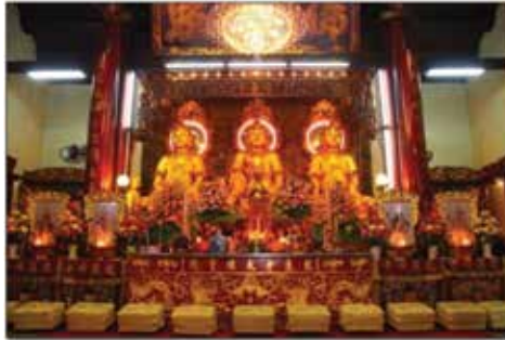
ภาพที่ 8 วิหารกลาง พระอุโบสถ