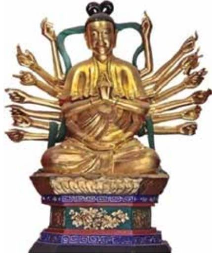
ภาพที่ 22 จุนทิมุสสิก