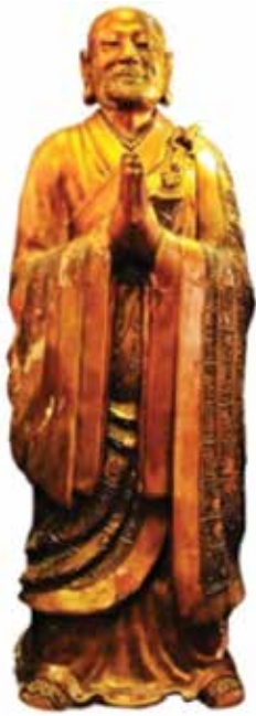
ภาพที่ 24 พระอานนท์