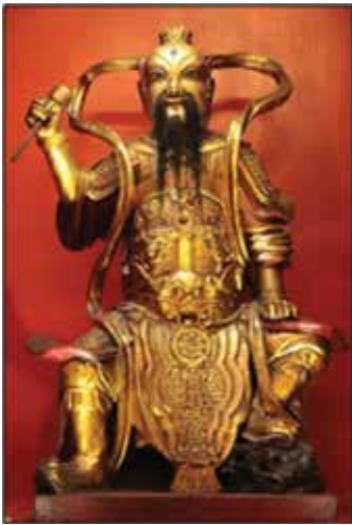
ภาพที่ 31 กำไลมือสักคือเทพอัคคี

เทพเจ้ามี 2 กลุ่ม กลุ่มหนึ่งเป็นกลุ่มที่ชาวจีนนับถือทั่วประเทศ เช่น ขงจื๊อ บุนเซียง เกี่ยวกับการศึกษา เทพเจ้ากวนอู มี 2 สถานะคือสถานะเป็นเทพเจ้ารักษาวัด เป็นพระโพธิสัตว์รักษาคุ้มครองวัด เรียกว่า แคน่าผู้สัก พระสังฆารามโพธิสัตว์ อีกสถานะหนึ่งคือทางเต๋า จะนับถือเป็นเทพเจ้าคุ้มครองประชาชน เทพเจ้าแห่งความซื่อสัตย์ อย่างเทพกำไลมือสักคือเทพอัคคี ซึ่งคนจีนถือว่าเทพอัคคีเป็นเทพเจ้าที่สำคัญเพราะที่ไหนมีการหุงต้มอาหาร ในจีนเราก็เลยบอกว่าท่านเป็นพระโพธิสัตว์เหมือนกันเพราะดูแล้วดี แต่ชาวบ้านคือเจ้าที่ดูแลไฟ