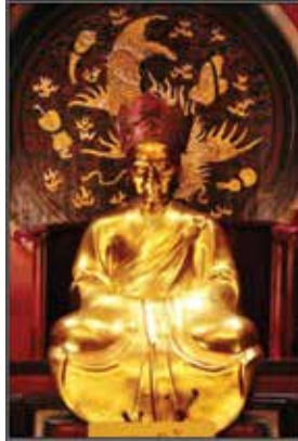
ภาพที่ 28 หลักโจว