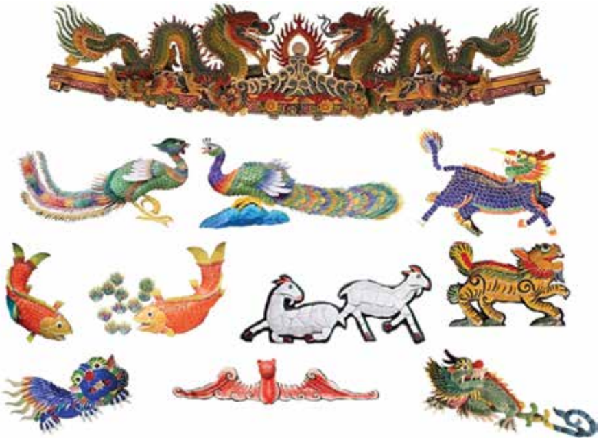
ภาพที่ 16 ประติมากรรมรูปสัตว์มงคลต่างๆ เช่น มังกรคู่ หงส์คู่ ปลามังกร แพะ เสือ สิงโต ค่างคาว กิเลน ฯลฯ