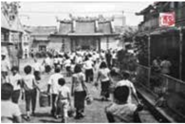
ภาพที่ 1 วัดมิ่งกรมลาวาส สมัยก่อน

วัดมิ่งกรมลาวาสเดิมชื่อ วัดเล่งเน่ยยี่ ถือได้ว่าเป็นวัดที่มีประวัติความเป็นมาที่ยาวนาน ได้มีการดำเนินการก่อสร้างเมื่อปี พ.ศ. 2414 โดย พระอาจารย์จิ้นวังสสมาธิวัตร (สกเห็ง) เพื่อเผยแพร่พระพุทธศาสนาลัทธิมหายาน ต่อมารัชกาลที่ 5 ได้ทรงพระกรุณาโปรดเกล้าฯ พระราชทานนามวัดใหม่ว่า วัดมิ่งกรมลาวาส พระอุโบสถเป็นสถาปัตยกรรมแบบวัดจีน หลังคามุงกระเบื้องลอนประดับลายปูนปั้นรูปสัตว์และเครือเถา มีพระประธานเป็นพระพุทธรูปสีทองแบบจีน หอโถงด้านหน้าพระอุโบสถตั้งแท่นสำหรับสักการบูชา วิหารด้านหน้าพระอุโบสถประดิษฐานรูปท้าวจตุโลกบาล เป็นรูปหล่อเขียนสี แต่งกายแบบนักรบจีน ด้านข้างเป็นเทพเจ้าตามความเชื่อในลัทธิเต๋าและเทพเจ้าพื้นเมืองของจีน ส่วนด้านหลังมีวิหาร 3 หลัง คือ วิหารอวโลกิเตศวร ประดิษฐานรูปเจ้าแม่กวนอิม วิหารปฐมบูรพาจารย์ ประดิษฐานรูปเหมือน พระอาจารย์จิ้นวังสสมาธิวัตร และวิหารสังฆปริณายก ประดิษฐาน เขียนหลักโจ้ว มีผู้เลื่อมใสศรัทธาเข้ามานมัสการหมู่เทพ ซึ่งเชื่อกันว่าจะให้คุ้มครองและอำนวยผลในด้านต่างๆ เช่น รักษาโรค อำนวยผลด้านการค้า และอำนวยผลสำเร็จด้านคู่ครอง