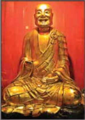
ภาพที่ 27 ตักม้อโจวซื่อ

ดังนั้นเท่ากับว่า 3 องค์ มีตักม้อโจวซื่อ, หลักโจว, สกเห็งโจวซื่อ เป็นการสืบต่อทางสาย บูรพาจารย์