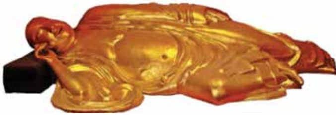
ภาพที่ 23 พระพุทธเจ้า

ส่วนใหญ่ในพระอุโบสถจะมีพระพุทธรูปเป็นประธาน 3 องค์บ้าง 1 องค์บ้าง 5 องค์ก็มี ก็จะมีบริวารหลายอย่าง มีพระอรหันต์ชาย-ชวา และในพระอุโบสถในมหายานเราจะมีพระอัครสาวก 2 องค์ วัดจีนเราไม่ได้เป็นพระโมคัลลานะและพระสารีบุตร แต่เราเป็นพระมหากัสสปะกับพระอานนท์ เพราะว่าจีนเราถือว่าพระมหากัสสปะเป็นผู้ดูแลพระพุทธรูปศาสนาต่อจากพระพุทธเจ้า ตอนที่พระพุทธเจ้าปรินิพพานแล้ว แต่ว่าพระอัครสาวกก็ยังคงเป็นพระโมคัลลานะกับพระสารีบุตรเหมือนกับทางไทย เพียงแต่ว่าเวลาตั้งรูปเคารพเขาจะตั้งพระมหากัสสปะ เพราะนิยายเซนถือว่าพระมหากัสสปะเป็นบูรพาจารย์ องค์ที่ 1 พระอานนท์คือองค์ที่ 2 เพราะฉะนั้นเขาถือว่าผู้สืบทอดจากพระพุทธเจ้าก็คือพระมหากัสสปะกับพระอานนท์ เท่ากับเป็นการสืบทอดคำสอนมหายาน