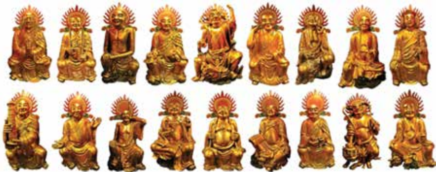
ภาพที่ 26 พระอรหันต์ 18 พระองค์ ภายในพระอุโบสถของวัด

วิหารบูรพาจารย์ วิหารหลักใจ้ว เป็นการสะท้อนความเชื่อแบบจีน เพราะจีนเรานับถือ และให้ความสำคัญกับบูรพาจารย์ เพราะถือว่าเป็นผู้สืบทอดคำสอนจากพระพุทธเจ้ามา เพราะฉะนั้นอย่างวัดมิ่งกรมลาวาส สะท้อนให้เห็นว่า เราสืบทอดคำสอนมาจากนิกายเซน เพราะว่าบูรพาจารย์ของวัดมีอยู่ 3 จุด คือจุดโนโบสถ์ก็จะมีตึกม้อโจวซื่อ ถือเป็นต้นองค์กรแรกของนิกายเซน หลักใจ้ว เป็นองค์ที่เผยแพร่ต่อลงมาทางภาคใต้ เป็นองค์ที่ 6 ของนิกายเซน ส่วนสกุเห็งโจวซื่อ เป็นผู้นำเข้ามาในประเทศไทย