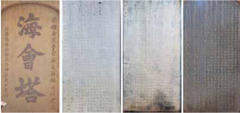
ภาพที่ 37 ป้ายสฎูปเจดีย์ทั้ง 4 ด้าน

- ส่วนภาษาจีนฝั่งซ้าย คือได้บูรณะซ่อมแซม เมื่อปี 37 ของสหรัฐอเมริกา ปี ค.ศ. 1949 ซึ่งตรงกับปี หมิงกั๋ว ของจีน และ ปี พ.ศ. 2492 ของไทย