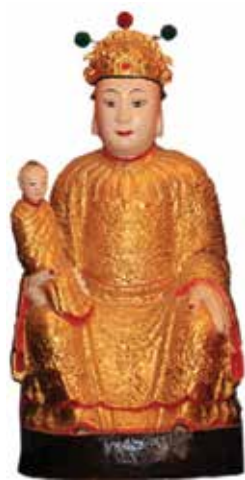
ภาพที่ 33 เสี้ยอึ้งกง(หลักเมือง) ภาพที่ 34 แป๊ะกง - แป๊ะม่า (เจ้าที่) ภาพที่ 35 กงพัว (แม่ซื้อ)

กงพัว คนจีนเขาบูชากันอย่างนี้ จีนทางใต้เชื่อกันว่าชีวิตมนุษย์เหมือนกับดอกไม้ อยู่ในสวน ซึ่งมีตำนานเล่าว่า มีตายายเป็นคนดูแลสวนดอกไม้ ซึ่งเกี่ยวข้องกับว่าดอกไม้สีแดงคือเด็กผู้หญิง ดอกไม้สีขาวคือเด็กผู้ชาย ดอกแต่ละดอกจะอยู่ในสวน 15 ปี แล้วถึงจะออกไปเติบโตข้างนอก คนก็เชื่อว่าจะมีตายายคอยดูแล จึงเรียกว่า กงพัว แนวคิดอันนี้ก็มิได้อยู่ คือเทพเจ้าประจำครอบครัว เดิมเป็นเทพเจ้าประจำเตียงนอน เพราะฉะนั้นเวลาคนจะไหว้กงพัวที่บ้าน เขาจะตั้งของไหว้ไว้บนเตียงนอนถือว่าจะได้ดูแลลูกหลานในบ้าน อีกแนวคิดหนึ่งของคนจีนกวางตุ้ง เขาไม่บูชา 2 องค์ เขาบูชาองค์เดียว เรียกว่า กิมฮวยฮูหยิน ดูแลเด็ก ขอลูก คู่ครองเด็ก ที่วัดตั้งบูชาแค่องค์เดียว เป็นการสะท้อนแนวคิดของคนจีนกวางตุ้ง แต่โบราณคนที่ไหว้สมัยก่อนเขาจะตั้งคู่กัน กิมฮวยฮูหยินคู่กับไฉ่ซิงเอี้ยนู้ สมัยก่อนตั้งไว้ด้วยกัน