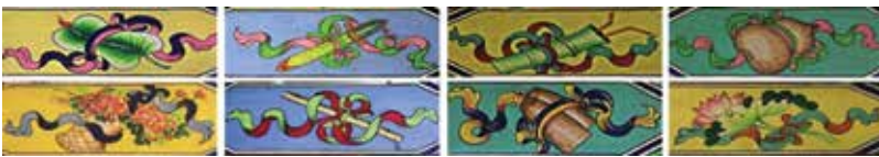
ภาพที่ 11 ภาพจิตรกรรม แปรวิเศษของไฝ่เขียน หรือ อั้นปาเขียน สัญลักษณ์มงคลตามแบบเต๋า

ด้านจิตรกรรมนั้น สามารถพบเห็นได้ทั่วไป โดยเริ่มตั้งแต่ประตูวัดด้านนอก จะเห็นรูปของผลไม้และไม้มงคลต่างๆ เช่น ทับทิม ต้นไผ่ ส่วนที่บานประตูใหญ่ เมื่อเปิดเข้าหากัน ก็เป็นรูปวาดของมังกรเพราะเชื่อว่า มังกรคือสัตว์ศักดิ์สิทธิ์ มีหน้าที่เฝ้าสถานที่ป้องกันภูตผีปีศาจ ภายในวัดจะเห็นภาพวาดบนช่อคานของตัวอาคาร ส่วนมากเป็นภาพวาดของสิบแปดอรหันต์ เทพไฝ่เขียน รูปเมฆ รูปต้นไผ่ ฯลฯ บริเวณผนังด้านหลังรูปปั้นของอาจารย์เว่ยหลง (เป็นชาวเมืองชิงโจว ศิษย์ของพระสังฆปริณายกรูปที่ 5 ต่อมาได้รับการสืบทอดตำแหน่งเป็น พระสังฆปริณายกรูปที่ 6 นิกายฉวน และได้เผยแพร่พระธรรมอยู่ที่วัดหนานหัว มณฑลกวางตุ้ง จนมรณภาพ โดยสรีระท่านไม่เน่าเปื่อย) มีภาพเขียนด้วยทองเป็นรูปปลามังกรขนาดใหญ่ชาวไทยเชื้อสายจีนเป็นชนชาติที่เชื่อในเรื่องของมงคลต่างๆ ทั้งนี้เนื่องจากชีวิตประจำวันของชาวไทยเชื้อสายจีนมักผูกพันกับเรื่องราว การดำรงชีวิต การพึ่งพิงพลังอำนาจจากธรรมชาติ ดังนั้น ความเชื่อของชาวไทยเชื้อสายจีนจึงถ่ายทอดผ่านสัญลักษณ์ออกมาในความหมายของความมีมงคลแก่ผู้มาเยี่ยมเยียน ไม่ว่าจะเป็นรูปสัตว์ เช่น มังกร ปลา ค้างคาว กระต่าย ฯลฯ รูปต้นไม้ต่างๆ เช่น ไผ่ ดอกโบตั๋น เห็ดหลินจือ ฯลฯ หรือสัญลักษณ์ของธรรมชาติ เช่น คลื่นในทะเล เมฆ ไข่มุกไฟ ฯลฯ (จิตติพล มีลาภ, 2549 : 6-7)