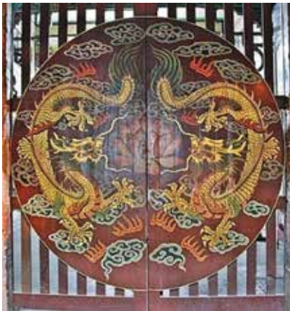
ภาพที่ 14 ภาพวาดรูปมังกรที่ประตูใหญ่ตรงทางเข้าวัด