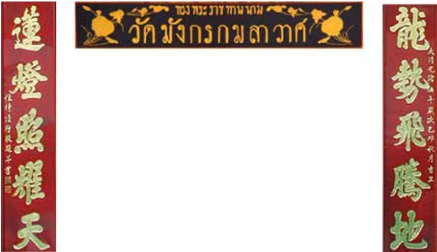
ภาพที่ 10 ป้ายพระราชทานนามของวัด และป้ายโคลงกลอน

โคลงนี้เป็นโคลงกลอนที่แต่งขึ้นในสมัยราชวงศ์ชิงโดยจักรพรรดิคังซื่อ ในปี ค.ศ. 1879 และถือได้ว่าเป็นงานศิลปะด้านการเขียนลายมือจีนที่มีค่ามากขึ้นหนึ่ง นอกจากนี้ภายในวัดยังมีป้ายที่เขียนขึ้น ในสมัยราชวงศ์ชิง ซึ่งตรงกับสมัยรัชกาลที่ 5 มีอายุกว่า 100 ปี ที่กล่าวถึงปรัชญาต่างๆ อีกจำนวนหนึ่ง