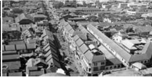
ภาพที่ 2 วัดมิ่งกรมลาวาส ประมาณปี พ.ศ. 2498

ปัจจุบันวัดมิ่งกรมลาวาสมีอายุครบ 142 ปี มีผลงานศิลปกรรมที่ใช้ประดับและตกแต่งตามวิหาร อาคารต่างๆ ภายในวัดเป็นจำนวนมาก เนื่องจากผลงานทัศนศิลป์ที่ถูกสร้างขึ้นมานั้น ล้วนแต่สร้างขึ้นมาจาก คติความเชื่อของพุทธศาสนา มหายาน วัดมิ่งกรมลาวาสถือได้ว่ามีอายุที่เก่าแก่และยาวนานมาก จึงทำให้งานทัศนศิลป์บางส่วนภายในวัดทรุดโทรมหลายจุด จนมาถึงปี พ.ศ. 2553 ทางวัดได้มีโครงการบูรณปฏิสังขรณ์ วัดใหม่หมดทั้งวัด จึงทำให้งานทัศนศิลป์บางแห่งยังคงเดิมเอาไว้ บางวิหารก็ถูกทำลายและสร้างขึ้นใหม่ เช่นวิหารสักการะ จากแต่เดิมเป็นเพียงเสาต้นไม้ มุงหลังคากระเบื้อง มีงานศิลปะเล็กน้อย ปัจจุบันเปลี่ยนมาเป็นวิหารสักการะที่สร้างด้วยไม้สักทั้งหลัง มีงานฉลุ แกะสลัก ด้วยไม้สักทั้งวิหาร จึงทำให้วัดแห่งนี้มีความสุนทรีย์ภาพเพิ่มมากขึ้น วัดแห่งนี้มีประวัติยาวนานและมีผลงานทัศนศิลป์ ดังนี้