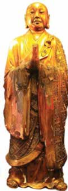
ภาพที่ 25 พระมหากัสสปะ