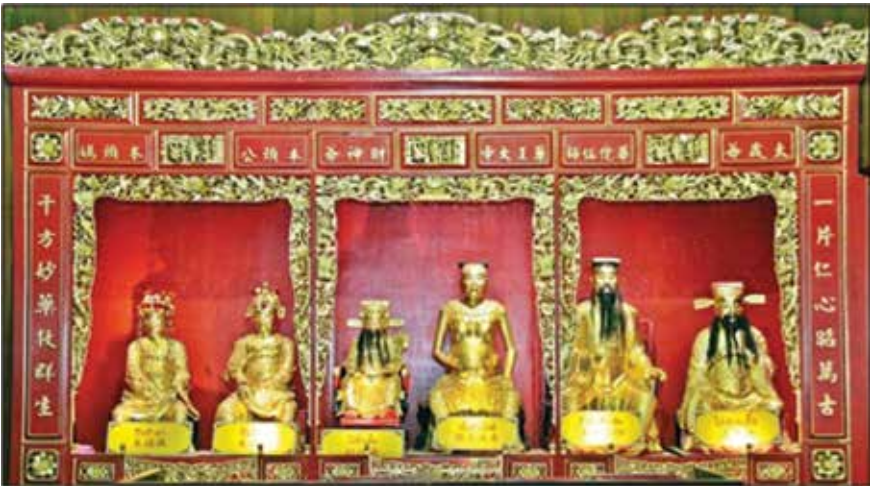
ภาพที่ 30 จากซ้ายไปขวา (ปึงเถ่ากง, ปึงเถ่ามา, ไฉฉิ่งเอี้ย, เอี้ยอ้วงไตตี, เซียงซือกง, ไท่ส่วยเอี้ย)

ปฏิมากรรมเทพเจ้า วัดในประเทศจีนบางแห่งก็มีบางแห่งก็ไม่มี ขึ้นอยู่กับว่า ความนิยมของท้องถิ่น แต่ว่าวัดจีนเรา เรามายู่ในดินแดนโพ้นทะเล วัดกลายเป็น ศูนย์กลางของชุมชนไม่ว่าจะเป็นพุทธ ขงจื้อ เต๋า อะไรต่างๆ ทำให้วัดเป็นที่รวมของ ศรัทธา ทำให้กิจกรรมภายในวัดนอกจากจะบูชาพระพุทธรูปเจ้าพระโพธิสัตว์ แบบพุทธ มหายานแล้ว ก็ยังให้มีเทพเจ้าเป็นที่พึ่งของชาวบ้านอีกอย่างหนึ่ง การที่วัดจีนใน ประเทศไทยเรามีเทพเจ้าไม่ใช่ว่าเทพเจ้าจะสำคัญเท่าพระพุทธรูปเจ้าไม่ใช่ หรือว่าพุทธ