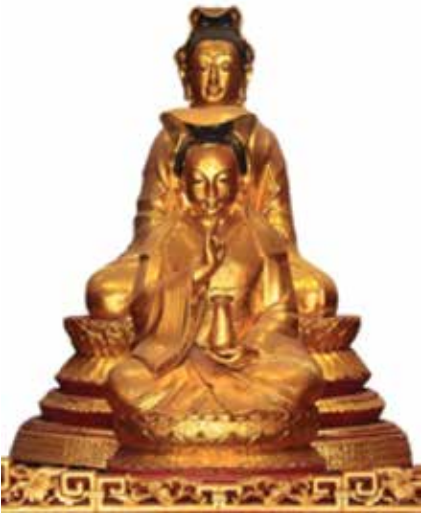
ภาพที่ 21 เจ้าแม่กวนอิม