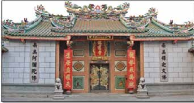
ภาพที่ 7 วิหารหน้า ทำวจตุโลกบาล

ใช้เป็นเครื่องมือในการกล่อมเกลาจิตใจของผู้ที่มากกราบไหว้บูชา ซึ่งความเชื่อเหล่านี้ได้เข้าไปรวมกับกิจวัตรของชาวไทยเชื้อสายจีนจนเรียกได้ว่าเป็นธรรมเนียมปฏิบัติ ซึ่งในหนึ่งรอบปี โดยเฉพาะอย่างยิ่งในวันตรุษจีน ชาวไทยเชื้อสายจีนเหล่านั้นจะต้องไปไหว้เจ้าในวัดมังกรกลลาวาส เพื่อจะได้บังเกิดความเป็นสิริมงคลแก่ตนเองและครอบครัว (จิตรา ก่อนนทเกียรติ, 2544 : 13-15)