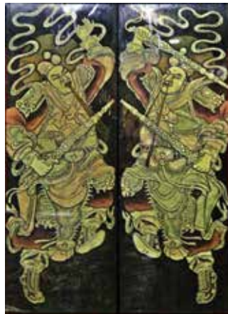
ภาพที่ 15 ภาพวาดบานประตูหน้าวิหารเทียนอ้วง