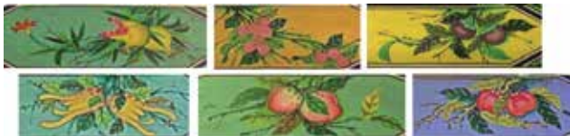
ภาพที่ 12 ภาพจิตรกรรม ผลไม้มงคล