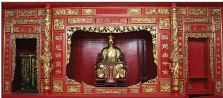
ภาพที่ 9 วิหารหลัง บูรพาจารย์