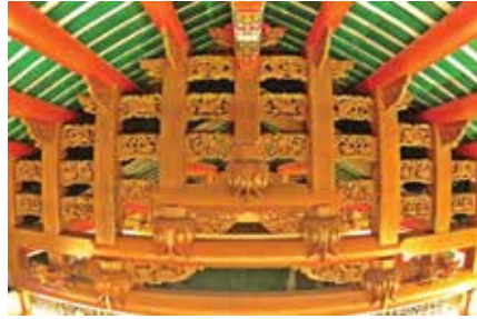
ภาพที่ 4 วิหารสักการะแบบใหม่หลังบูรณะ

วัดมิ่งกรมกลาวาส ตั้งอยู่ ณ เลขที่ 423 ถนนเจริญกรุง เขตป้อมปราบศัตรูพ่าย กรุงเทพมหานคร สร้างในรัชสมัยพระบาทสมเด็จพระปรมินทรมหาจุฬาลงกรณ์พระจุลจอมเกล้าเจ้าอยู่หัว (พระปิยมหาราช) รัชกาลที่ 5 ทรงพระกรุณาโปรดเกล้าฯ ให้เลือกชัยภูมิที่สร้างวัดเล่งเน่ยยี่ ในเนื้อที่ 4 ไร่ 18 ตารางวา โดยให้พระยาโชฎึกราชเศรษฐีเจ้ากรมท่าซ้าย ร่วมกับพุทธศาสนิกชนชาวจีนดำเนินการก่อสร้างเมื่อปี พ.ศ. 2414 ใช้ระยะเวลาในการก่อสร้างประมาณ 8 ปี จึงแล้วเสร็จ ตั้งชื่อว่า “เล่งเน่ยยี่” ซึ่งมีความหมายคือ “เล่ง” แปลว่า มังกร “เน่ย” แปลว่า ดอกบัว “ยี่” แปลว่า วัดวาอาราม การตั้งเชื่อว่าจะตั้งตามหลักโบราณจีน คือการตั้งตามชัยภูมิ ฮวงจุ้ยทำเลนั้นๆ ซึ่งนับเป็นสังฆาราม ตามลัทธินิคายมหายานที่มีศิลปะงดงามและใหญ่ที่สุดในประเทศไทย ซึ่งภายหลังได้รับพระราชทานพระกรุณาโปรดเกล้าฯ จากพระบาทสมเด็จพระจุลจอมเกล้าเจ้าอยู่หัว พระราชทานนามใหม่ว่า “วัดมิ่งกรมกลาวาส” โดยได้อาราธนาพระอาจารย์สกเห็งเป็นเจ้าอาวาส มีสมณศักดิ์ เป็นพระอาจารย์จีนวังสสมาธิวัตร ดำรงตำแหน่งเจ้าคณะใหญ่อินนิการูปแรกในประเทศไทย (มังกรสาร, 2550 : 22)