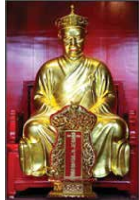
ภาพที่ 29 สกเห็งโจวซื่อ