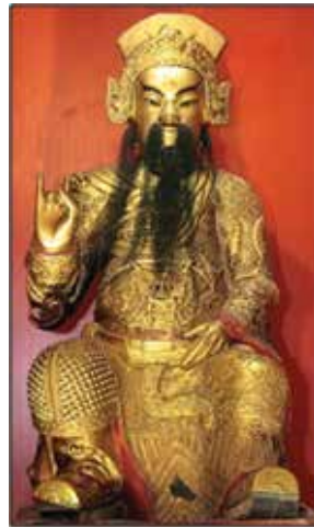
ภาพที่ 32 เทพเจ้ากวนอู

ส่วนเทพเจ้าอื่น เป็นเทพเจ้าพื้นบ้านที่คนจีนนับถือเป็นประจำ หมายความว่าทุกๆ ปีจะต้องบูชาเทพเจ้าเหล่านี้ อย่างเช่นฮั่วท้อเซียงซือ ก็บัดเปาโรคภัยไข้เจ็บ เอี้ยอ้วงผู้สัก เป็นเทพเจ้าเกี่ยวกับสมุนไพรรักษาโรค การเกษตร ก็ไหว้เทพเจ้าองค์นี้เช่นกัน ปึงเต่ากวาง ปึงเต่ามา จะดูแลชุมชนเป็นเหมือนเทพารักษ์และทุนทรัพย์ด้วย คำขาย ก็ไหว้ด้วย ไฉ้ซึ้งเอี้ย คือเทพเจ้าแห่งโชคลาภ ซึ่งภายในวัดจะมี 2 ปาง คือปางบู๊กับปางบุน